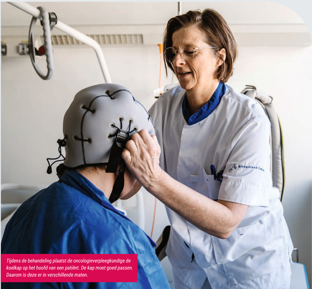
Tijdens de behandeling plaatst de oncologieverpleegkundige de koelkap op het hoofd van een patiënt. De kap moet goed passen. Daarom is deze er in verschillende maten.

Meer informatie over hoofdhuidkoeling op www.kanker.nl en geefhaarenkans.nl .